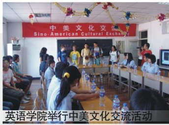
英语学院举行中美文化交流活动