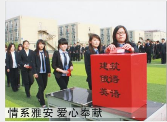
情系雅安 爱心奉献