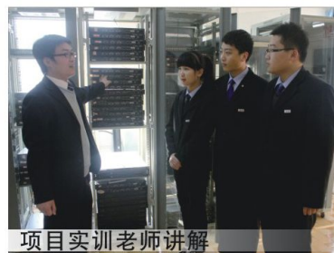
项目实训老师讲解