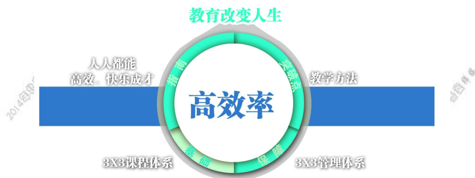
学校自设招生专业一览表（3X3 课程体系——课程设置前沿）

经过多年探索，八维教育形成了以教育改变人生为目标，以“人人都能高效、快乐成才”教育理念为指南，以 3x3 课程体系为基础，以 3×3 管理体系为保障，以教学方法为突破点的高效率的教育模式。