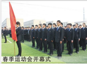
春季运动会开幕式