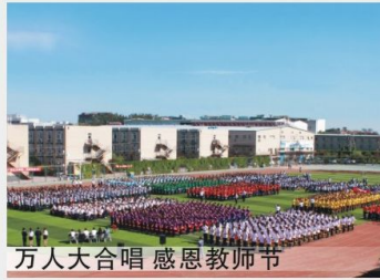
万人合唱 感恩教师节