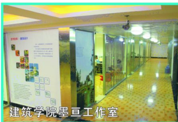
建筑学院墨巨工作室

各专业均设有独立工作室，真实企业场景，规范化企业模式，通过项目开发和技术沙龙，锤炼专业技能，全面提升职业素养。学生在这里完成“角色变动”，实现从学生到技术骨干的转变。