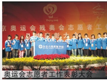
奥运会志愿者工作表彰大会