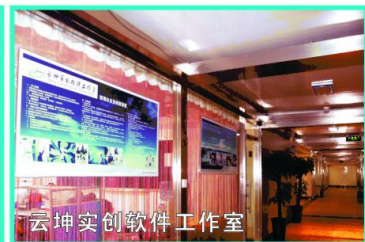
云坤实创软件工作室